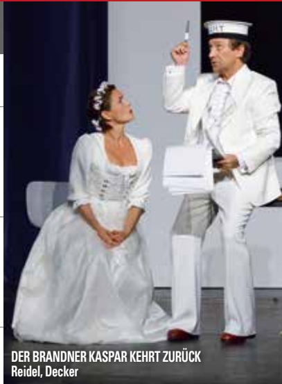
DER BRANDNER KASPAR KEHRT ZURÜCK Reidel, Decker