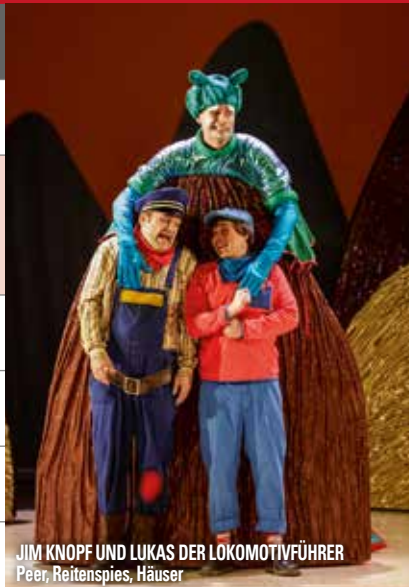
JIM KNOPF UND LUKAS DER LOKOMOTIVFÜHRER Peer, Reitenspies, Häuser