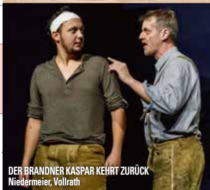
DER BRANDNER KASPAR KEHRT ZURÜCK Niedermeier, Vollrath