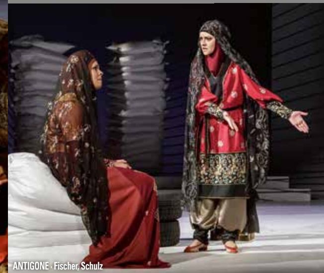
ANTIGONE · Fischer, Schulz

Tragödie von Sokokles 7. Februar 2018, um 10.00 Uhr