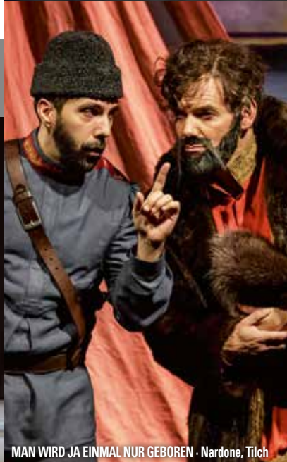
MAN WIRD JA EINMAL NUR GEBOREN · Nardone, Tilch