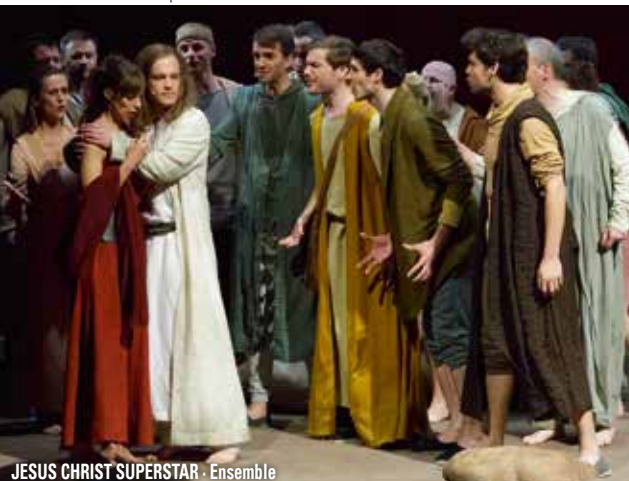
JESUS CHRIST SUPERSTAR · Ensemble

31 19.30 Freier Verkauf / zum letzten Mal Fr LA WALLY 22.00 Oper von Alfredo Catalani