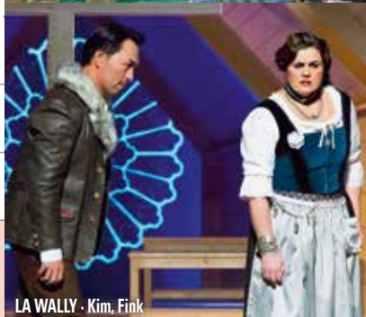
LA WALLY · Kim, Fink