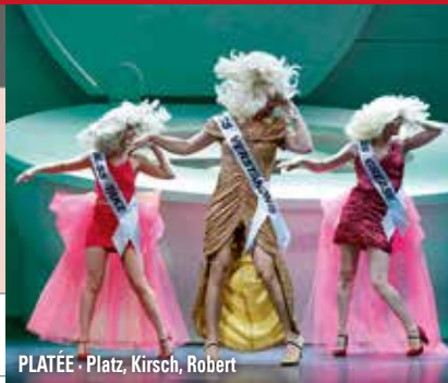
PLATÉE · Platz, Kirsch, Robert