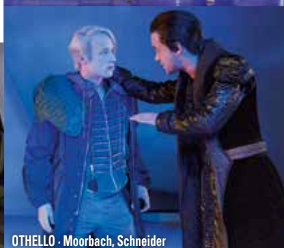
OTHELLO · Moorbach, Schneider