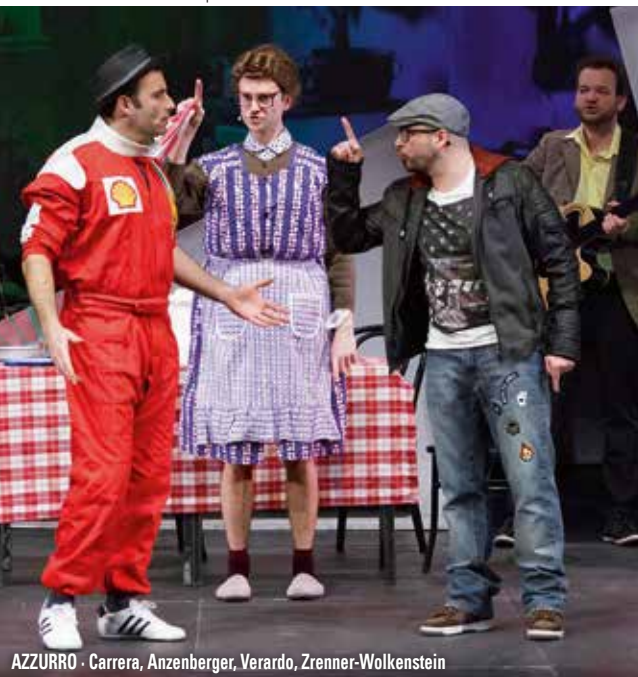
AZZURRO · Carrera, Anzenberger, Verardo, Zrenner-Wolkenstein