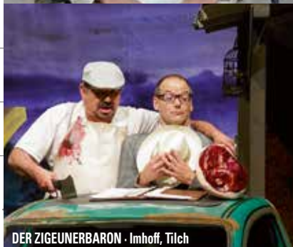
DER ZIGEUNERBARON · Imhoff, Tilch