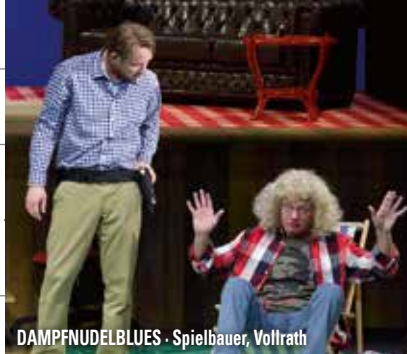
DAMPFNUDELBLUES · Spielbauer, Vollrath