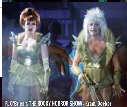
R. O'Brien's THE ROCKY HORROR SHOW · Kram, Decker